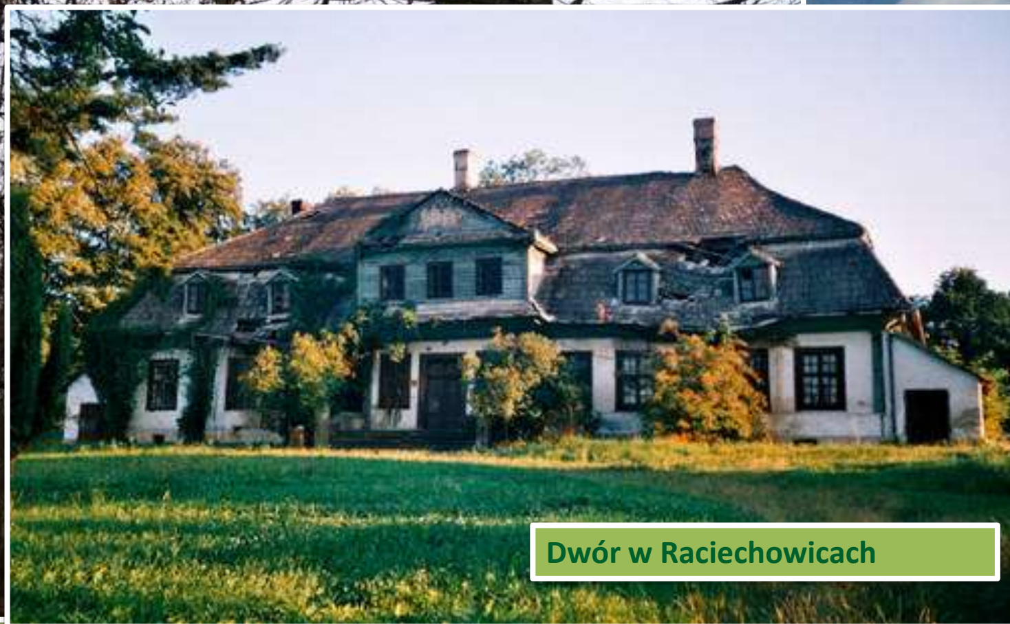
Dwór w Raciechowicach